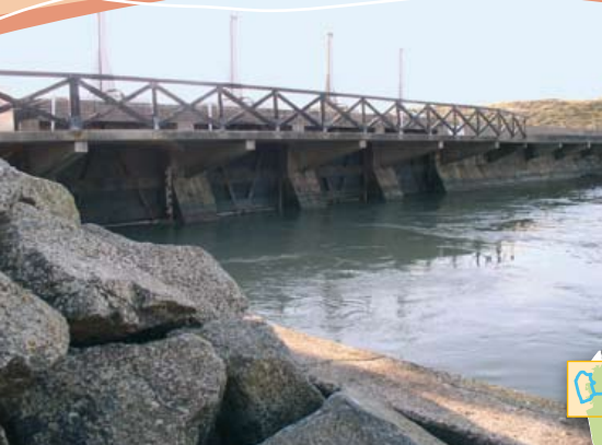
Ecluse des Granges (M.T. Poupard)